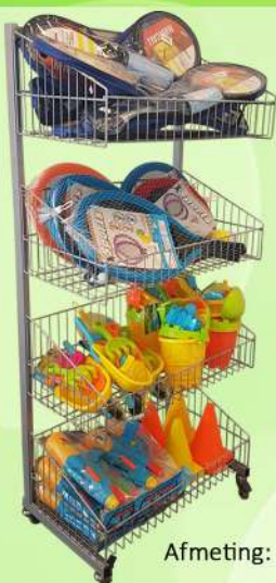
Speelgoed Nr. Z06

Meer informatie over de zonnebrillen en leesbrillen kunt u vinden in onze brillen folder