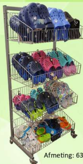
Strandschoenen Nr. Z11