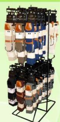
Stretchriemen Nr. T03